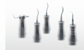
Mit den als Sonderzubehör lieferbaren Spitzen-Adaptoren können die Spraykanäle aller KaVo SONICflex Spitzen maschinell innen gereinigt werden.