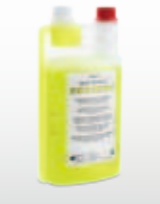
KaVo QUATTROclean Flasche