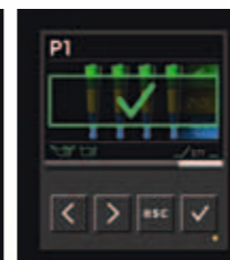
Prozess-Ende mit Erfolgsbestätigung.