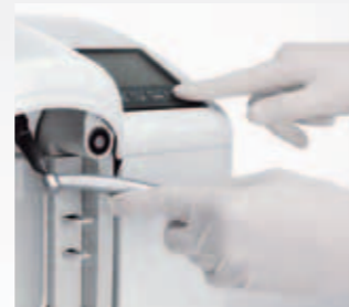
Spannzange des Instruments ansetzen und Programm starten.