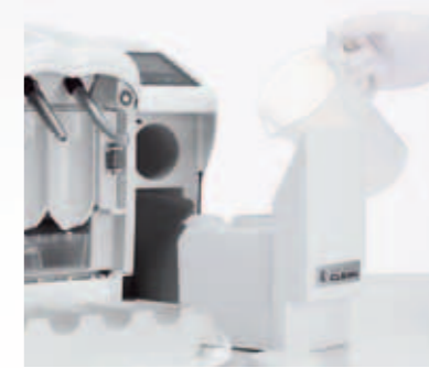
Reinigung mit demineralisiertem Wasser und KaVo QUATTROclean Reinigungszusatz.

KaVo QUATTROcare CLEAN – die wirtschaftliche Lösung für RKI-konforme Reinigung und werterhaltende Pflege.