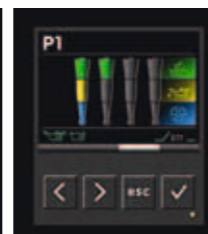
Fortschritts-Anzeige pro Instrument.