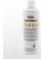
KaVo QUATTROoil Dose