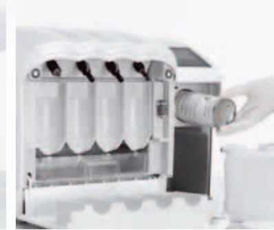
Pflege mit KaVo QUATTROoil.